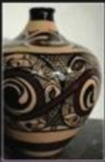
Кераміка ручної роботи натхненна стародавньою Трипільською культурою