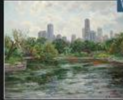
Internationally renowned classical artist of landscapes and portraits

VOLODYMYR MONASTYRETSKY/UKRAINE - U.S.A.