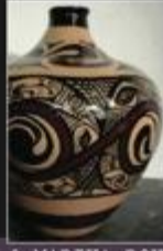
Handcrafted Ceramics inspired by the ancient Trypillian culture