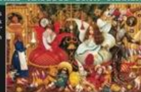
Whimsical illustrations from the book "100 Fairy Tales" by Ivan Malkovich