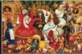
Ілюстрації з книг Івана Маликовича - "100 Казок"